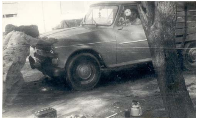
Doña Dorotea y Doña Segunda empujando el rastrojero

“Cuántos valores que nos ofrecieron al llegar para vivir con ellos de una manera parroquial! ¡Significativo intercambio de bienes!”