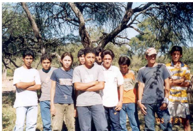
Grupo de los jóvenes becados en Campo Gallo, en el año 2003