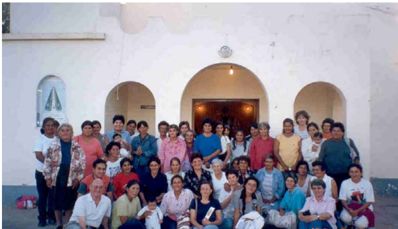
Encuentro de Cáritas parroquial en San José del Boquerón (junio 2003)

En cada una de las distintas localidades de la Parroquia hay entre diez y quince mujeres que trabajan en los talleres de costura, cocinan en los comedores escolares, reparten la comida no percedera a las familias con niños en edad de comedor infantil (2 a 6 años) y visitan a los ancianos (todo sin recibir compensación económica a cambio).