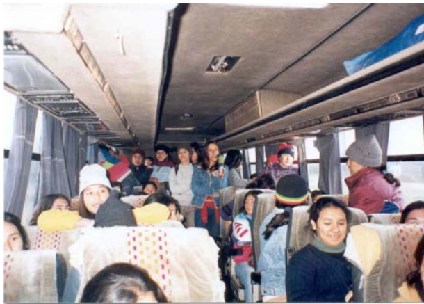
Los estudiantes becados en la ciudad de Añatuya regresan a la escuela después de las vacaciones de invierno.

Desde hace más de veinte años, gracias a la generosidad de muchas personas que ven la educación como un medio valioso para lograr la promoción de los individuos y de la comunidad en general (Grupos de matrimonios del P. Fabbri SJ, Grupo Compartir, Grupo del Colegio Goethe, Grupos AFA y Fiscalía, Familias Solidarias, etc., etc.) se ha organizado un programa de becas. A través del mismo logramos reunir el dinero necesario para cubrir los gastos que demanda el traslado y la permanencia de los jóvenes en lugares distantes de la Parroquia: hospedaje, alimentación, libros y útiles escolares, vestimenta, consultas médicas u odontológicas, etc.